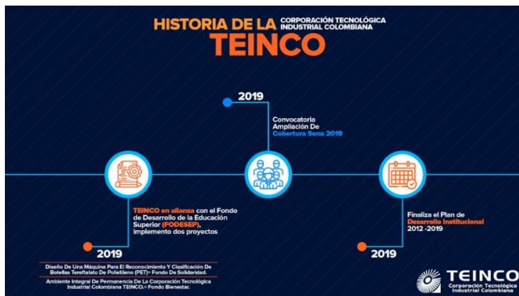
Figura 1. Línea de tiempo historia de TEINCO