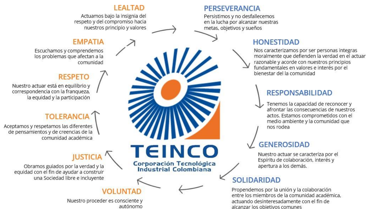
Figura 3. Valores Institucionales Corporación Tecnológica Industrial Colombiana TEINCO